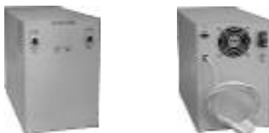
Рисунок 1. Внешний вид ИБП.

4.1 Конструктивно источник питания выполнен в виде настольного (напольного) блока со съемным кожухом (см. рисунок 1).